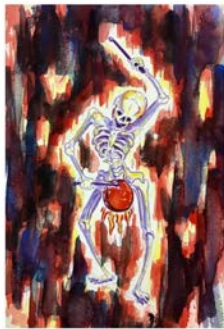
Let there be Light