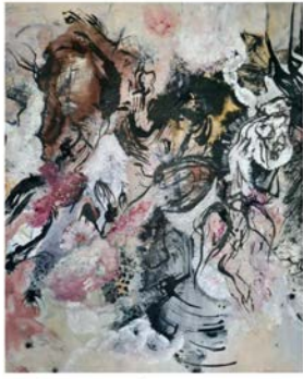
Fotsålene vet når de møter jorden